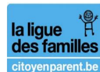
Ligue des Familles, Belgium