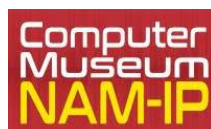
NAM-IP ASBL, Belgium