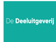
De Deeluitgeverij, Belgium