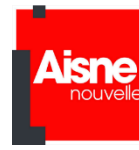
Aisne Nouvelle, France