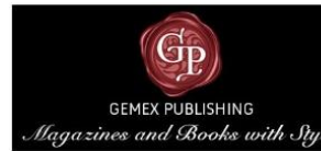
Gemex Publishing, Belgium