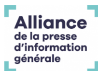
Alliance de la Presse d'Information Générale, France