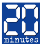
20 Minutes, France