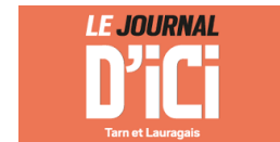
Le Journal d'Ici, France