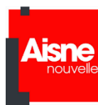
Aisne Nouvelle, France