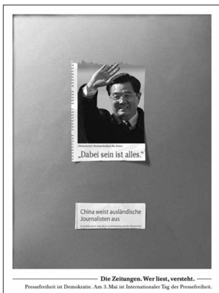
Zum Internationalen Tag der Pressefreiheit bieten BDZV und ZMG ein Sondermotiv im Rahmen der Imagekampagne: „Die Zeitungen. Wer liest, versteht.“ an.

view in gut 70 Tageszeitungen sowie auf zahlreichen Websites von Zeitungen und anderen Medien.