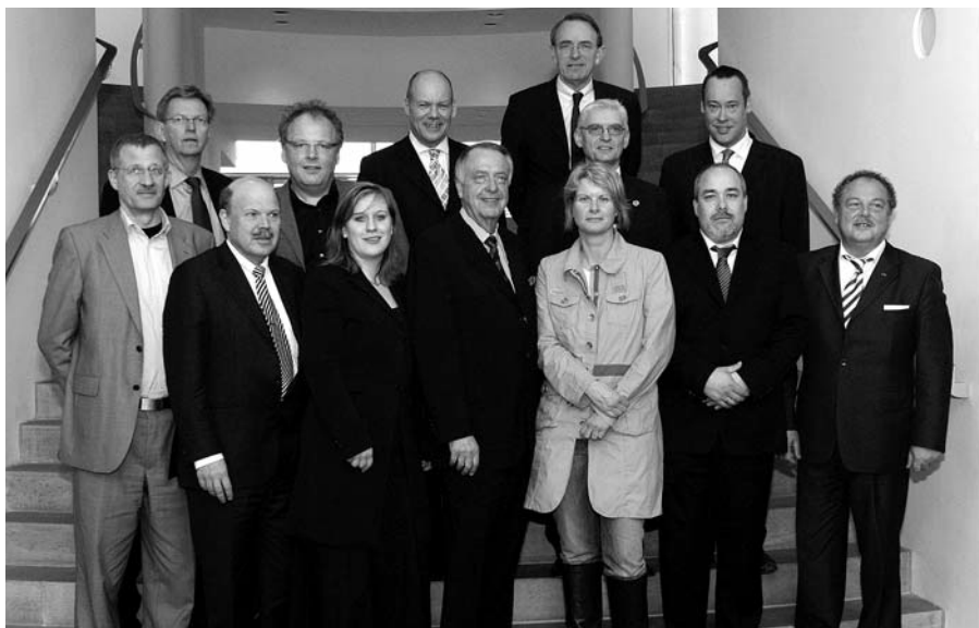
Ein Netzwerk aus Zeitungen und Zeitschriften zur Stärkung der Demokratie, das soll nach dem Willen von Bernd Neumann, Staatsminister für Kultur und Medien (vordere Reihe, 4.v.l.), die neue Initiative Printmedien befördern.

Umfrage, die der BDZV in Berlin anlässlich der Gründung der „Nationalen Initiative Printmedien – Zeitungen und Zeitschriften in der Demokratie“ durch Kulturstaatsminister Bernd Neumann veröffentlicht. Die Leseförderungsprojekte haben eine Dauer von zwei Wochen bis zu drei Monaten; in dieser Zeit liefern die Verlage insgesamt rund 23 Millionen Tageszeitungen und 760.000 Wochenzeitungen unentgeltlich an die Projektteilnehmer, um Kindern und Jugendlichen die intensive Beschäftigung mit „ihrer Zeitung“ zu ermöglichen.