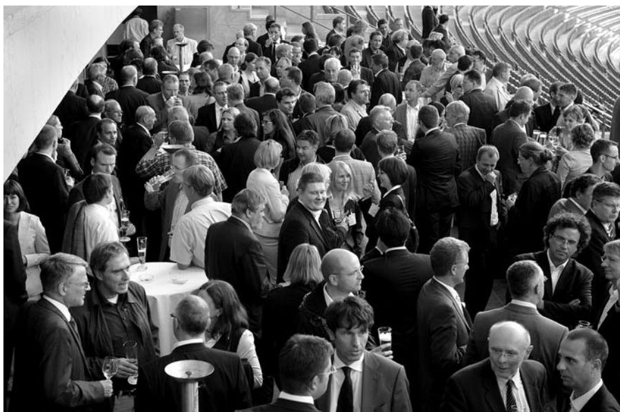
... und oben in der VIP-Lounge die Gäste beim Sommerfest des BDZV.