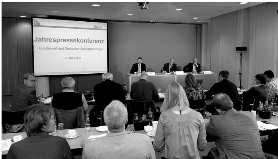
BDZV-Jahrespressekonferenz in Berlin: volles Haus bei der Veröffentlichung der aktuellen Daten für die Zeitungsbranche.

plane, mit Gratistiteln in den Pressemarkt zu drängen. Dazu Wolff: „Es wäre ein Skandal, wenn ein ehemaliges Staatsunternehmen, bei dem der Staat auch heute noch der größte Aktionär ist, versuchen würde, die etablierten Zeitungen im Leser- und Werbemarkt anzugreifen.“ Kritik übt der BDZV auch an neuen Eingriffen der EU in die Belange der Kommunikationswirtschaft. Wenn die Forderung des EU-Parlaments tatsächlich umgesetzt werde und künftig 20 Prozent der Autowerbung in Zeitungen für umweltbezogene Aussagen genutzt werden müssten, so führe dies automatisch zum Wegfall von Anzeigen. Eine solche Werbezensur könne im Extremfall zum Verlust von 500 Millionen Euro Anzeigenumsatz führen, mit allen absehbaren Folgen für die Leistungskraft der Zeitungen und die Arbeitsplätze in den Verlagen.