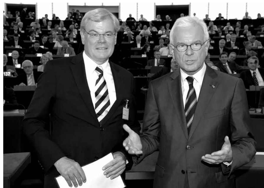
Der Präsident des Europäischen Parlaments, Hans Gert Pöttering (r.), hier mit BDZV-Präsident Helmut Heinen, begrüßt die deutschen Zeitungsverleger in Straßburg.

Ein „äußerst fragwürdiges Verständnis von Pressefreiheit“ moniert BDZV-Präsident Helmut Heinen bei der deutschen Regierung angesichts der jüngsten Serie von Ermittlungsverfahren gegen Journalisten wegen angeblicher Beihilfe zum Geheimnisverrat. Anlässlich der Eröffnung des Zeitungskongresses im Europa-Parlament in Straßburg sagt Heinen: „Jede Demokratie muss sich daran messen lassen, wie großzügig über die Tätigkeit staatlicher Institutionen berichtet werden kann.“ Der Präsident des Europäischen Parlaments, Hans-Gert Pöttering, versichert, dass das Europa-Parlament, wenn es geboten scheine, seine Stimme für die Pressefreiheit erhebe. Valdo Lehari jr., Präsident des Europäischen Zeitungsverlegerverbands ENPA und Verleger des „Reutlinger General-Anzeigers“, betont, dass Pressefreiheit immer dann am besten gedeihe, wenn sie frei von staatlichen Eingriffen gehalten werde. In der anschließenden Podiumsdiskussion zum Thema „Presse- und Meinungsfreiheit – Wohin steuert (uns) Europa?“ klären die Richterinnen am Europäischen Gerichtshof für Menschenrechte in Straßburg, Renate Jaeger; der Vorsitzende des Lenkungsausschusses für Massenmedien und Kommunikation im Europarat, Straßburg, Matthias Traimer; sowie Ruth Hier-