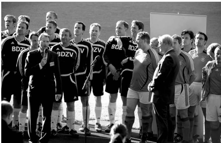
Im Berliner Olympiastadion: Unten auf dem Rasen tummeln sich die Fußballspieler ...