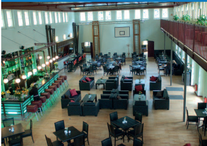
Abends wird es sportlich! Wir laden Sie ein, sich in einer ungewöhnlichen Berliner Location – der „Turnhalle“ mit Ihren Kollegen auszutauschen!